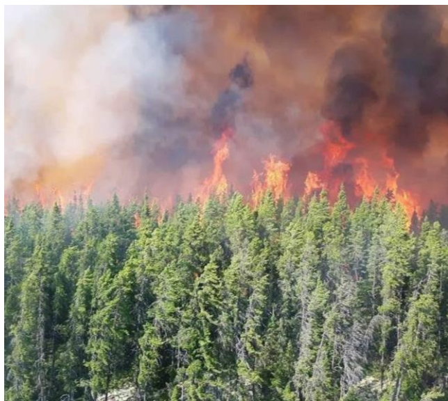
Feux de forêt

Les « événements météo » ont entraîné, depuis le début de l'année au Québec, le versement de presque 600 millions de dollars d'indemnités de la part des compagnies d'assurances en dommages. Le chiffre, six fois supérieur à la moyenne annuelle observée par le Bureau d'assurance du Canada (BAC) il y a 10 ans, fracasse déjà le record établi pour l'ensemble de 2022 – Le Devoir 14 septembre 2023