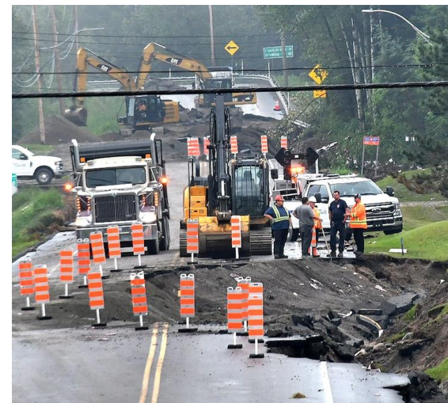
Forte pluie et glissement de terrain à Rivière Éternité