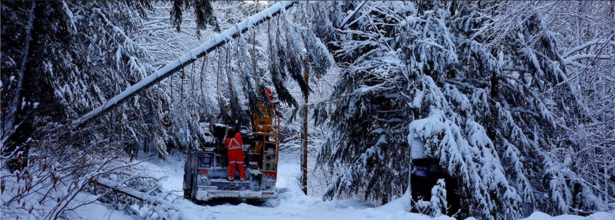
Photo: après la tempête du 23 décembre 2022 causant des milliers de pannes d'électricité au Québec et qui a coûté 55 M$ à Hydro Québec