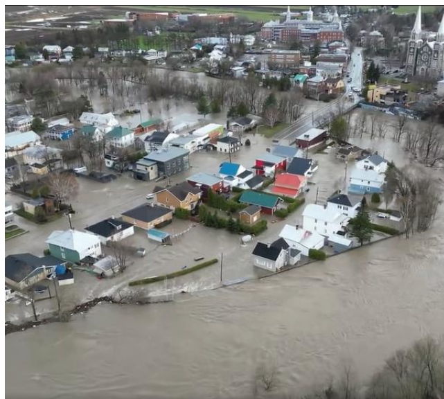
Inondation à Baie Saint-Paul